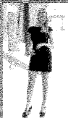
«Martina Stella ha paura dei volatili di ogni genere. E io ci ho fatto duemila battute»